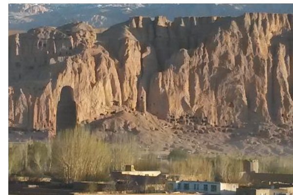
Progetto: Masterplan strategico di Bamian, Afghanistan, 2018

L'ateneo offre una serie di servizi rivolti agli studenti: trasporti, mense e alloggi, attività sportive, musicali, teatrali e un gran numero di facilitazioni riservate agli studenti.