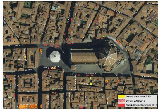
Progetto: I dehors a Firenze, 2017

Nel secondo anno lo studente ha a disposizione un ampio ventaglio di corsi che potrà scegliere in funzione dei propri interessi personali. L'offerta didattica viene erogata in stretto rapporto con i due Laboratori di eccellenza che hanno sede presso il Dipartimento: il Laboratorio di Geografia Sociale – LaGeS ( www.lages.eu ) e il Laboratorio di Geografia Applicata – LabGeo ( www.geografia-applicata.it ). Il corso orienta infine lo studente per lo svolgimento di stage e tirocini presso enti pubblici e privati nei settori dell'analisi e della progettazione territoriale e della cooperazione internazionale.