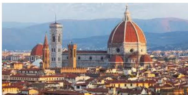
Sede del Corso: Centro Storico di Firenze

Per i requisiti di partecipazione al corso cfr. www.spatialmanagement.unifi.it